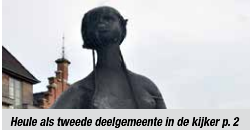
Heule als tweede deelgemeente in de kijker p. 2