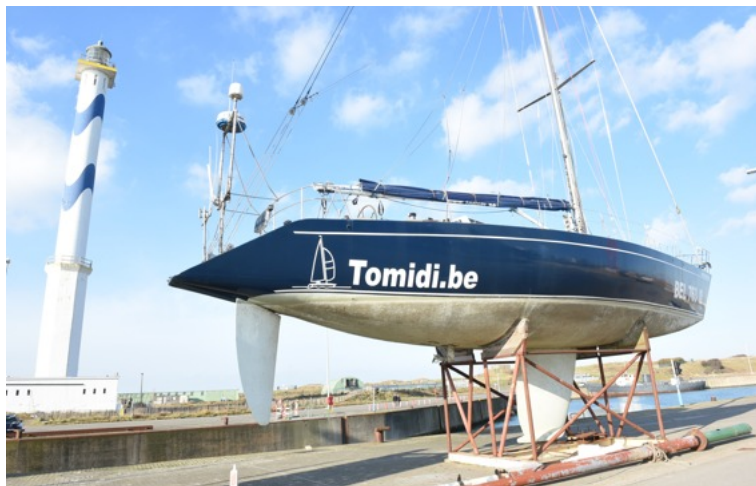
Het vaartuig staat al meer dan een jaar op de kade, te wachten op geïnteresseerden.