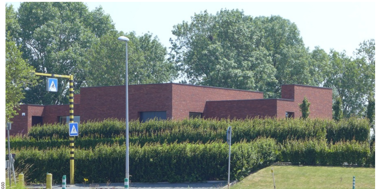
De homejackers belden dinsdag op klaarlichte dag aan bij de villa in de Dronckaertstraat.