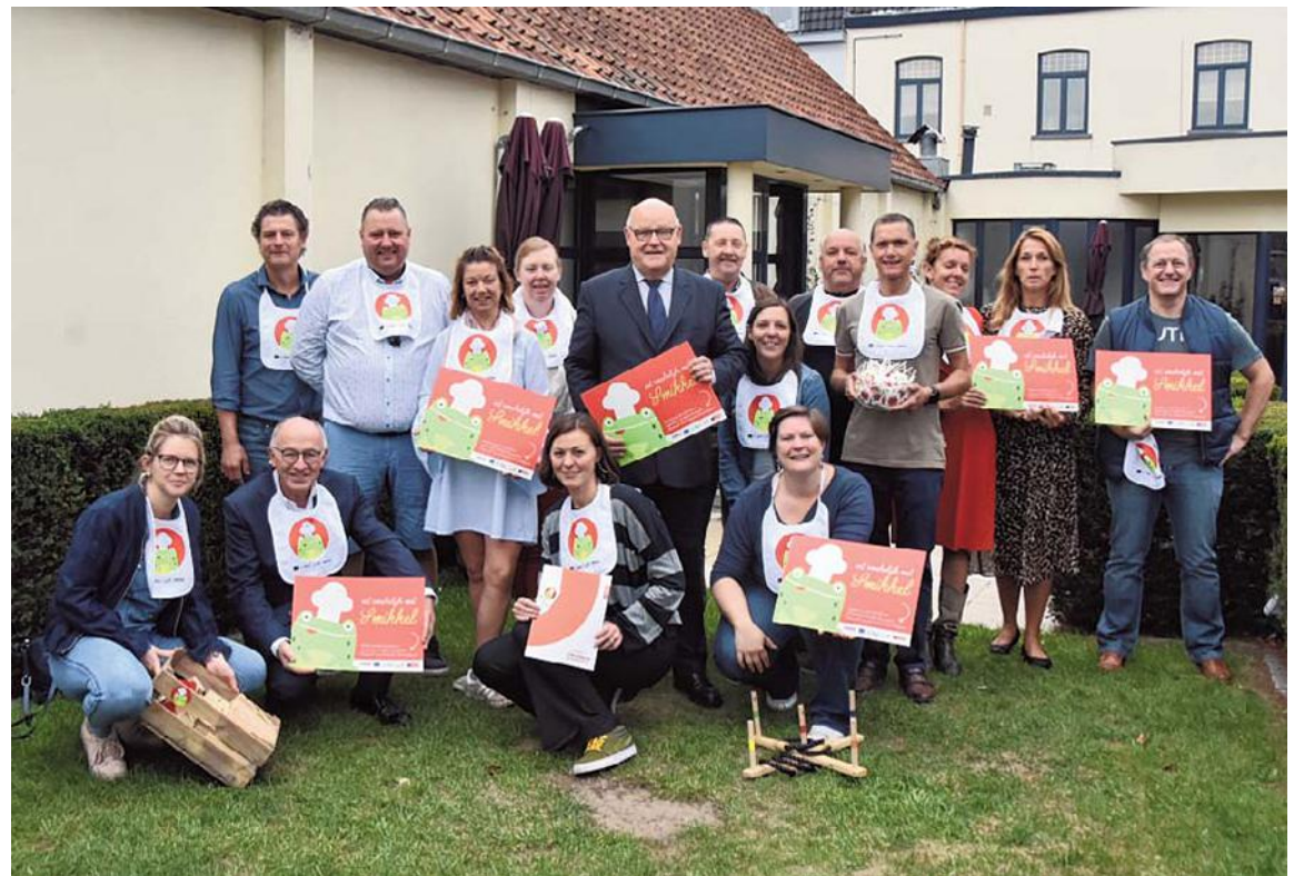
De Kortrijkse horecauitbaters werken samen met de stad Kortrijk en Horeca Vlaanderen.