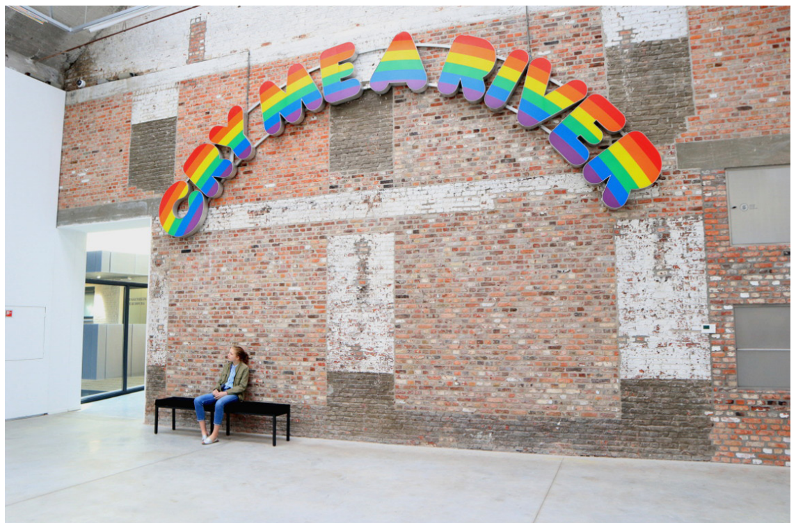
© Ugo Rondinone, CRY ME A RIVER, 1997. Neon, acrylglas, doorzichtige folie, aluminium, 750 x 350 x 10 cm. Van Haerents Art Collection, Brussel

De nabije toekomst draagt een belofte in zich van een nieuw narratief, een realiteit waarin wetenschap en andere hoogtechnologische oplossingen kritieke globale, sociale en individuele problemen kunnen oplossen. Utopische ideeën steunen sinds de 17de eeuw op de wetenschap en op nieuwe ontwikkelingen. De moderniteit wordt gekenmerkt door een ideologie waarin wetenschappelijke vooruitgang en het ideaalbeeld van een samenleving nauw met elkaar verbonden zijn. Wetenschappelijke ontwikkelingen en technologie zullen altijd een diepe impact hebben op het hedendaagse leven.