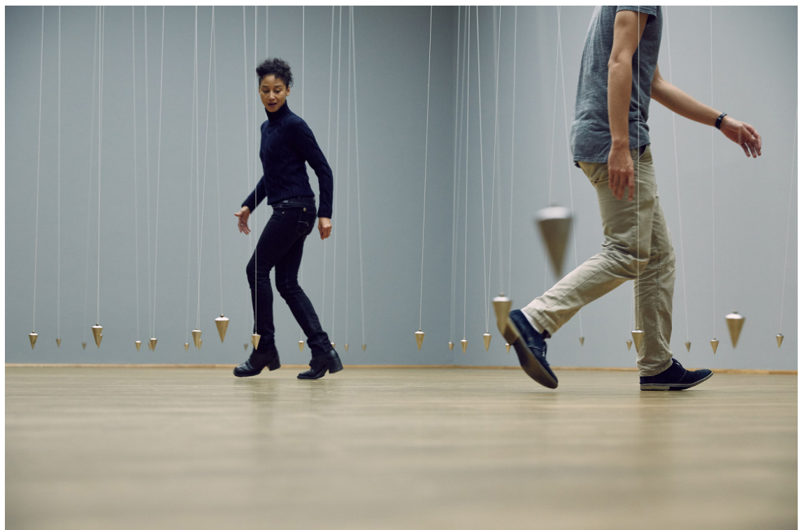
© William Forsythe, Nowhere and Everywhere at the Same Time No. 3, 2015. Schietlodens, koord, persluchtcilinders Variabele afmetingen. Met dank aan de kunstenaar. Collectie MMK Museum für Moderne Kunst, Frankfurt

Velen van ons zijn stadsmensen. De stad is onze nieuwe natuurlijke habitat geworden, een plaats die bedacht en ontworpen wordt door architecten en stadsplanners, die hun ontwerpen baseren op de basisconcepten van een utopie. Sinds jaar en dag willen mensen een ideale stedelijke context creëren, gebaseerd op de eigentijdse noden van de maatschappij, om de mens een beter leven te kunnen garanderen. Deze noden zijn echter tijdsgebonden en kunnen zeer snel veranderen wanneer oorlogsflicten of klimaatverandering een migratiegolf veroorzaken of wanneer de bevolkingsgroei exponentieel toeneemt.