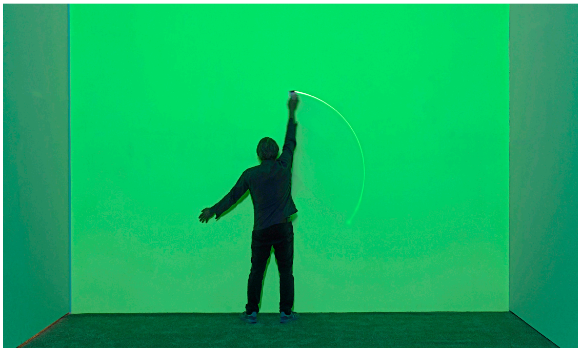
© Olaf Nicolai, HOW TO FANCY THE LIGHT OF A CANDLE AFTER IT IS BLOWN OUT, 2019. Installatie, uv-licht, lichtgevende verf, Variabele afmetingen. Met dank aan Galerie EIGEN + ART Leipzig/ Berlijn

Al eeuwenlang analyseren en construeren utopische denkers nieuwe sociale en politieke modellen die de weg naar dit toekomstige paradijs moeten vrijmaken. Doorheen de geschiedenis zijn filosofen, dichters, architecten en kunstenaars uit alle uithoeken van de wereld gefascineerd geweest door de menselijke drang om een ideale wereld te verbeelden, ontwerpen en definiëren. Het lijkt echter alsof onze huidige maatschappij gedreven wordt door angst en onrust. We zijn brutaal wakker geschud door de dreigende veranderingen in ons klimaat en kregen een catastrofale en dystopische toekomstvisie op ons bord geserveerd. Het uitsterven van de menselijke soort is – voor het eerst – een haast tastbaar toekomstbeeld geworden. Dit grimmige vooruitzicht komt op ons afgesneld als een overweldigende tsunami die overal ter wereld schade zal berokkenen. Daar waar de idealen van de flowerpowergeneratie nog vervuld waren van hoop en geloof, lijken onze dromen geplaagd door negatief denken. Hoe kan het ook anders, wanneer we dagelijks met deze onderwerpen geconfronteerd worden.