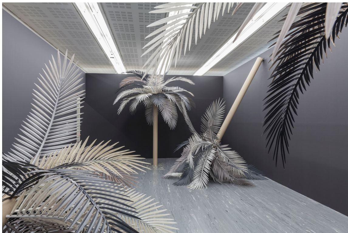
© Sarah Ortmeyer, OKO (I-III), 2015. Hars, staal, bindmiddel, pigment, Ca. 490 x 150 x 150 cm elk. Met dank aan de kunstenaar en Dvir Gallery Tel Aviv/ Brussel

We hebben allemaal een eigen idee van wat het paradijs voor ons zou betekenen. Voor velen is dat een zorgeloos leven leiden, in vrede en harmonie, zonder pijn. Het is het idee van een leven lang doen wat je graag doet en je dromen achterna kunnen gaan. Er zijn veel verschillende en vaak persoonlijke wegen naar het paradijs. Sommigen verbeelden zich het binnentreden van het paradijs als het bereiken van de hemelpoorten, het betreden van de Tuin van Eden of een wandeling door de Elyseese velden. Anderen zien het paradijs als een plaats of staat van ultiem geluk. Welvaart en een gevoel van vervulling of voldoening zijn terugkerende elementen in elke religie of mythe. De verbeelding van het paradijs bevraagt in de eerste plaats hoe we voor iedereen een betere samenleving kunnen creëren.